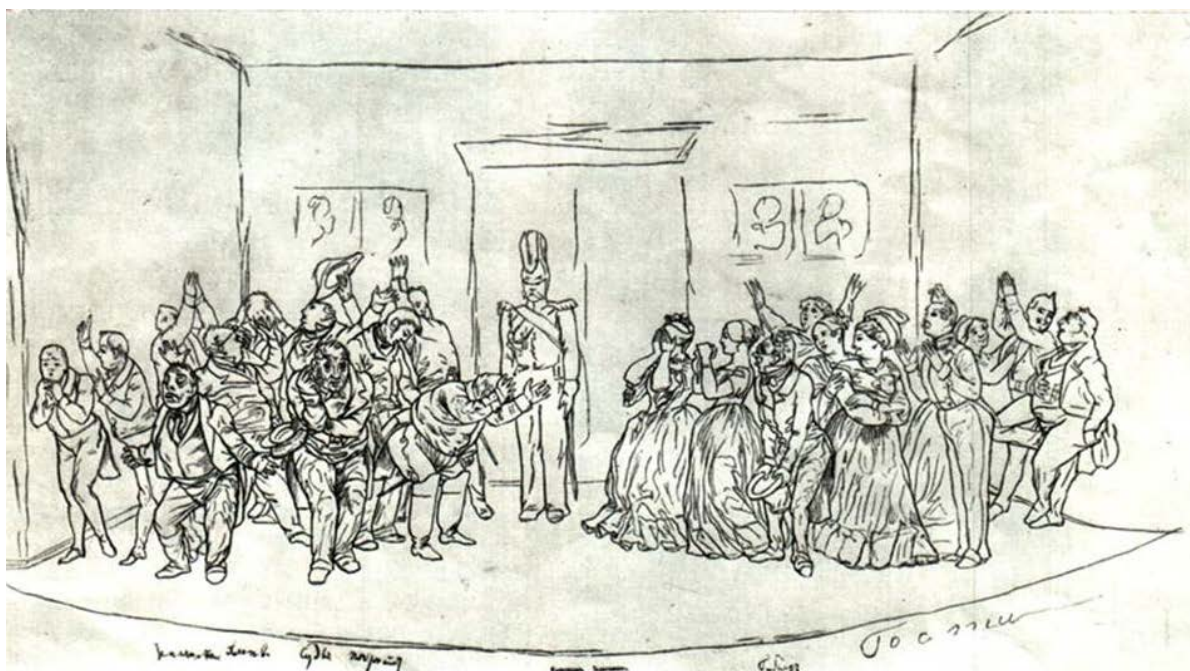
«РЕВИЗОР». ЗАКЛЮЧИТЕЛЬНАЯ СЦЕНА. Рисунок Н. В. Гоголя (?)

«Ревизор». Заключительная сцена. Рисунок Н.В. Гоголя (?), 1830-е гг.