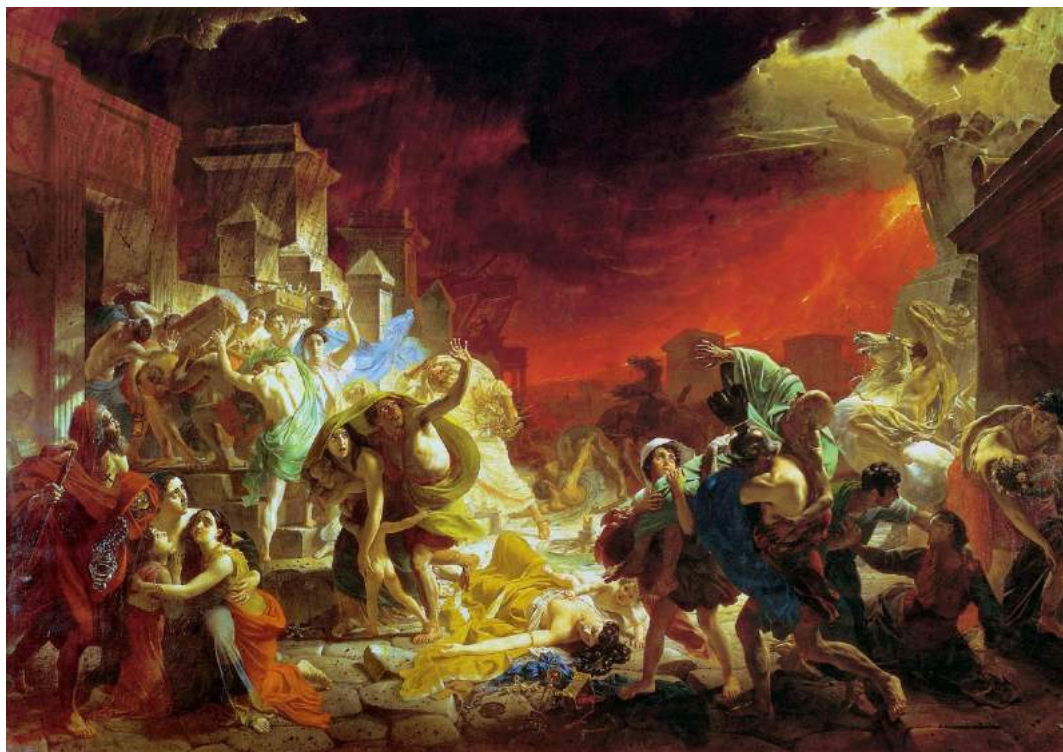
Карл Брюллов, «Последний день Помпеи», 1833