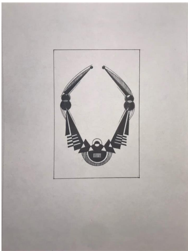
Пример работы по декоративной композиции