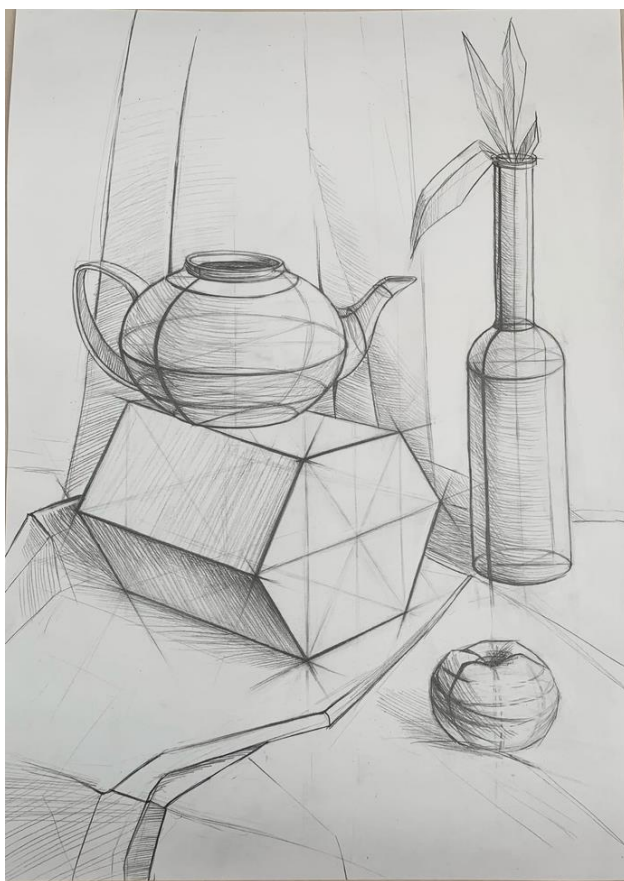
Примеры работ по техническому рисунку «Натюрморт»