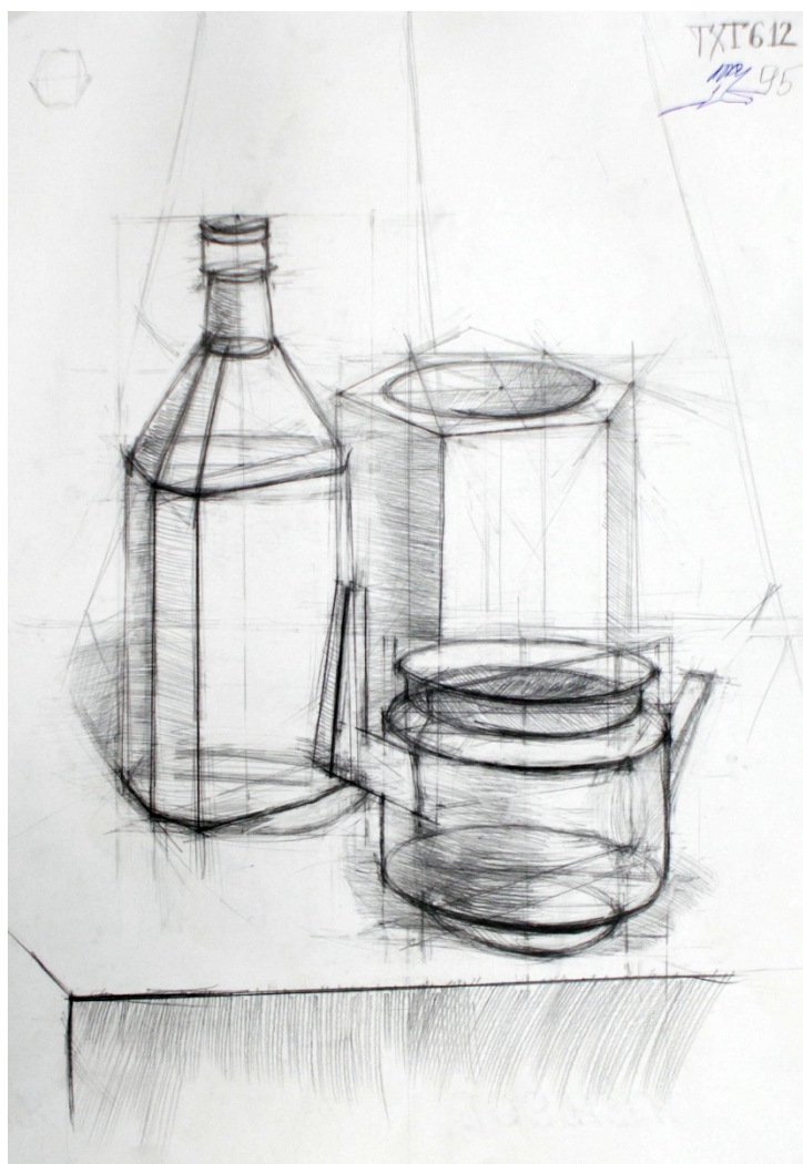
Пример работы по техническому рисунку «Натюрморт»