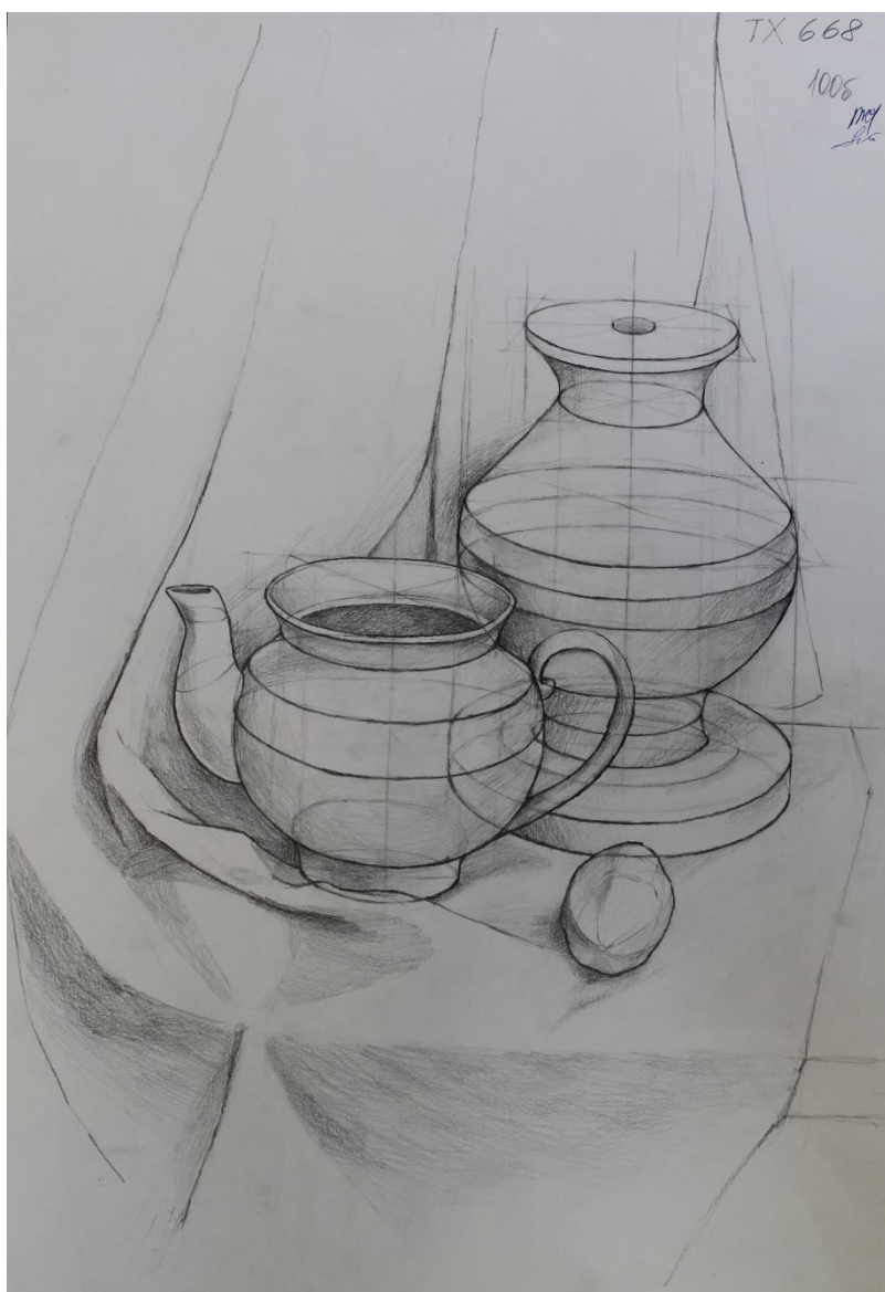
Пример работы по техническому рисунку «Натюрморт»