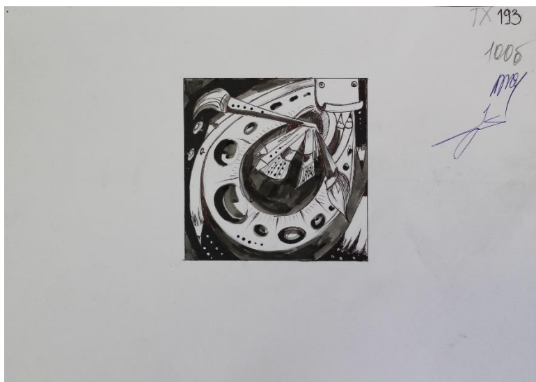
Пример работы по декоративной композиции с элементами канцелярских товаров

Задание выполняется на белой бумаге формата А-4.