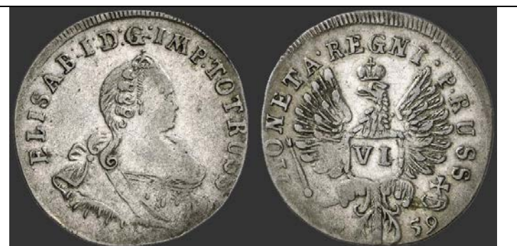
В. Восточная Пруссия (в зачет также – Кёнигсберг)

3. Соотнесите с датами события, относящиеся к присоединению Средней Азии к России (7 б.).