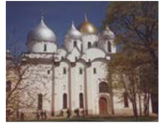
Никола-дворищинский собор (12 в.)