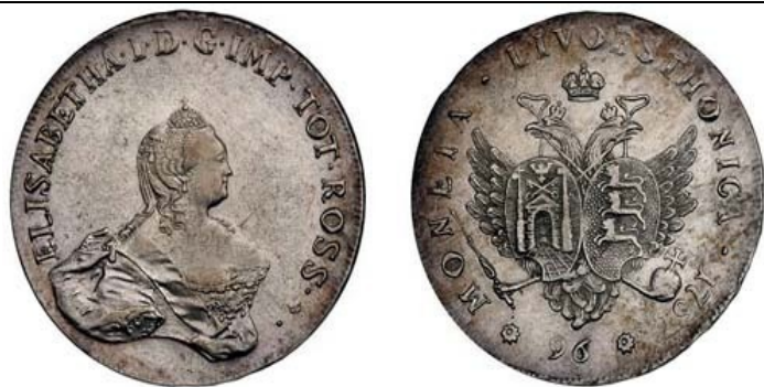
Б. Эстляндия и Лифляндия (в зачет также – Прибалтика)