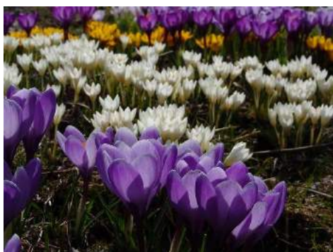
начало весны (вскоре после таяния снега)

Примечание. Отметим, что после начала цветения растение может цвести весь сезон. Но важно указать, когда появляются первые цветки. В списке даны примерные сроки для Нечерноземной зоны России.