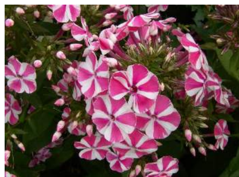
середина – конец лета