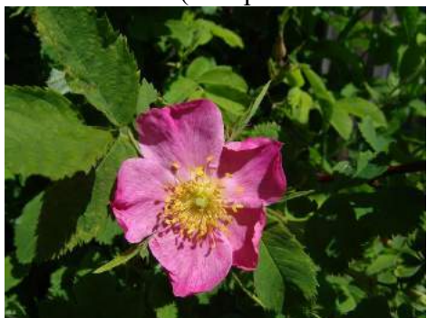
поздняя весна – начало лета (через 1–1,5 месяца после таяния снега)