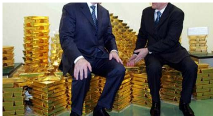
И Вам всего хорошего!

По предположению археологов, начало системной добычи было положено на Ближнем Востоке, откуда украшения, изготовленные из металла М , поставлялись, в частности, в Египет. Именно в Египте в гробнице королевы Зер и одной из королев Пу-аби Ур в Шумерской цивилизации были найдены первые украшения из этого металла, датируемые III тыс. до н. э.