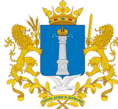
Ульяновска я область