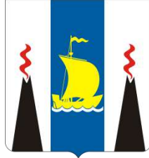
Сахалинск ая область