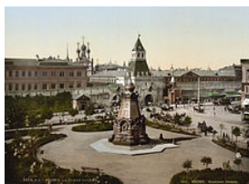
Памятник героям Плевны