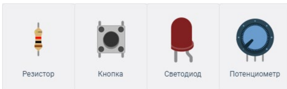
Рис.3. Изображения элементов, используемых в задании

В схему, созданную в первой части задания, необходимо дополнительно подключить еще одну кнопку и потенциометр. При включении третьей кнопки необходимо реализовать поочередное мигание всех светодиодов с задержкой, которая определяется как сумма задержки из 1-го задания и значения, получаемого с потенциометра.