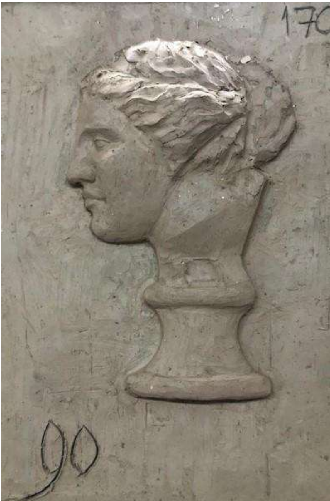
Савинова Алина – 90 баллов