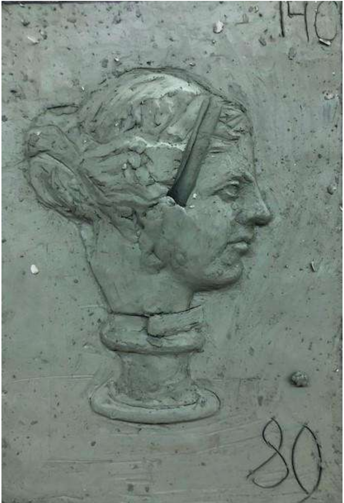
Овчинников Вадим – 80 баллов