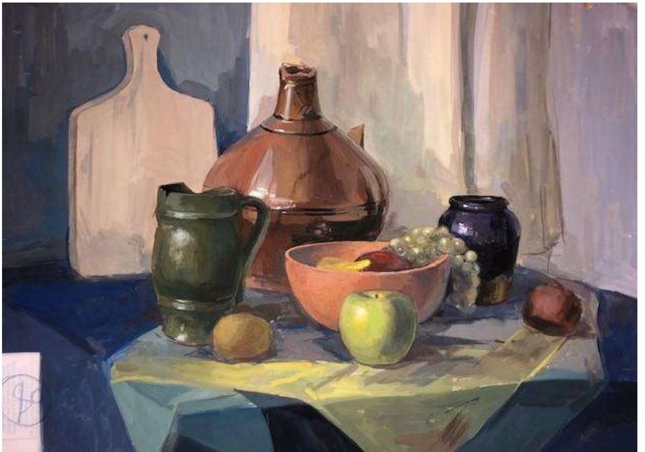
Литвиненко Злата 80 баллов