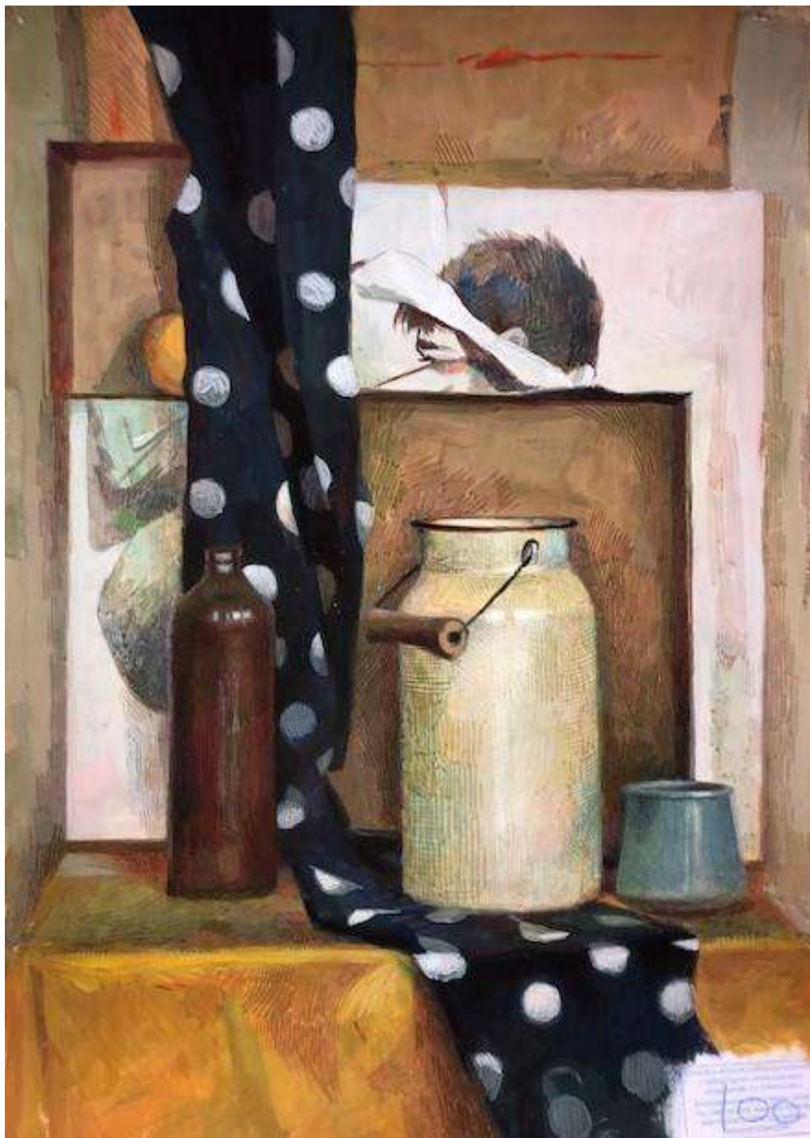
Артемова Валерия 100 баллов