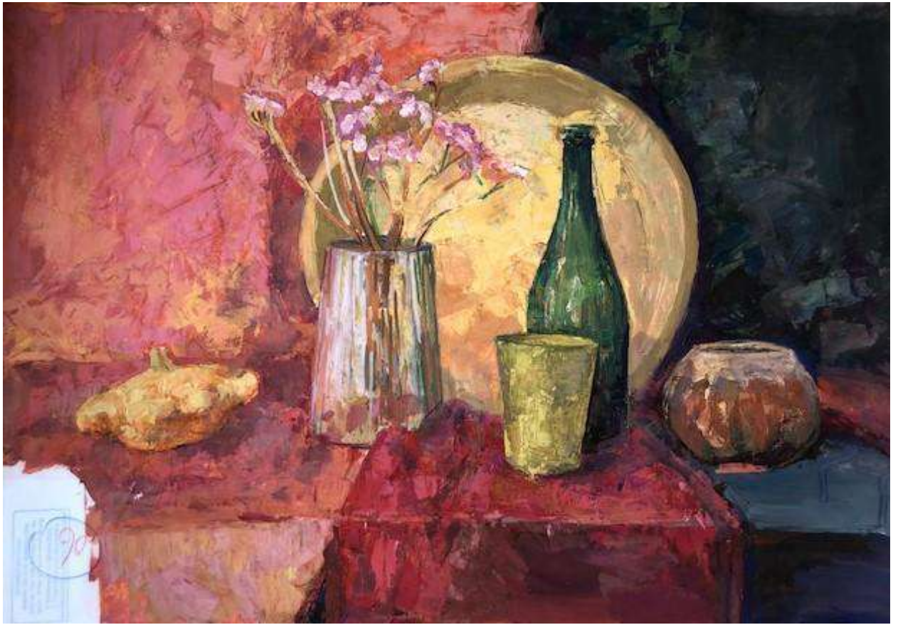
Шагова Дарья 90 баллов