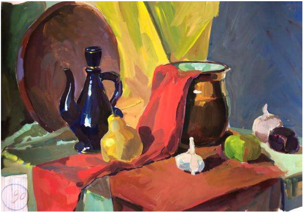
Щеголева Дарья 90 баллов