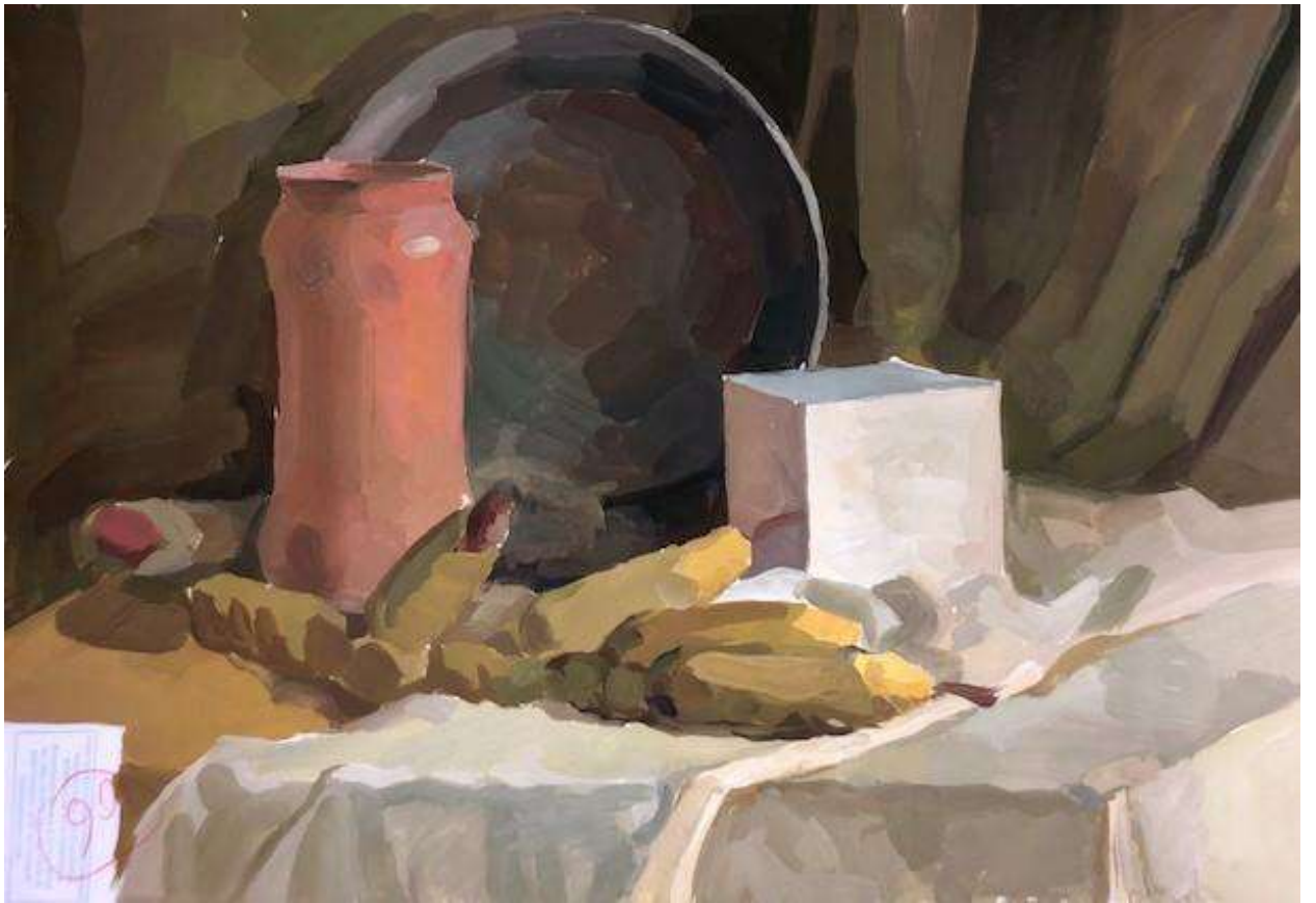
Тучкова Ульяна 90 баллов