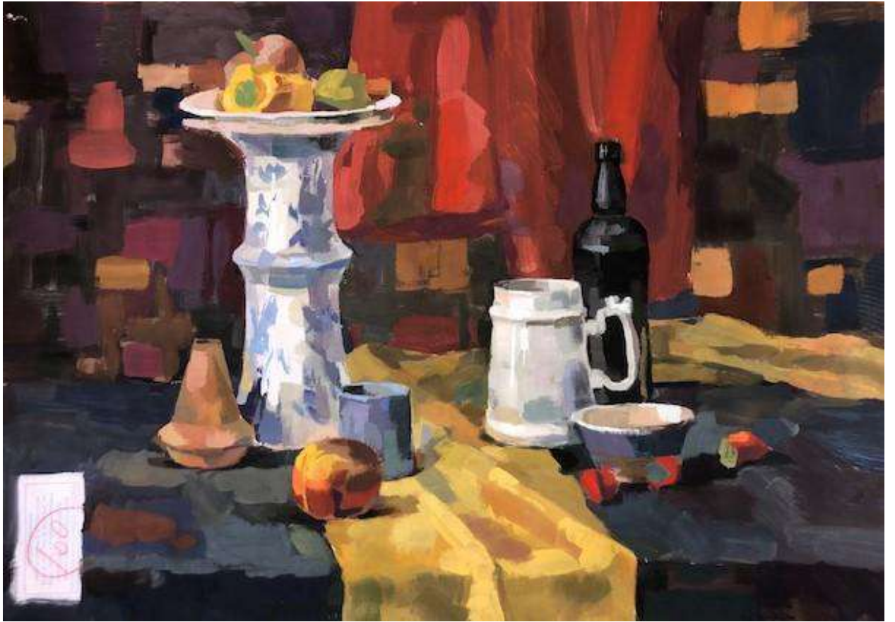
Резниченко Дина 100 баллов