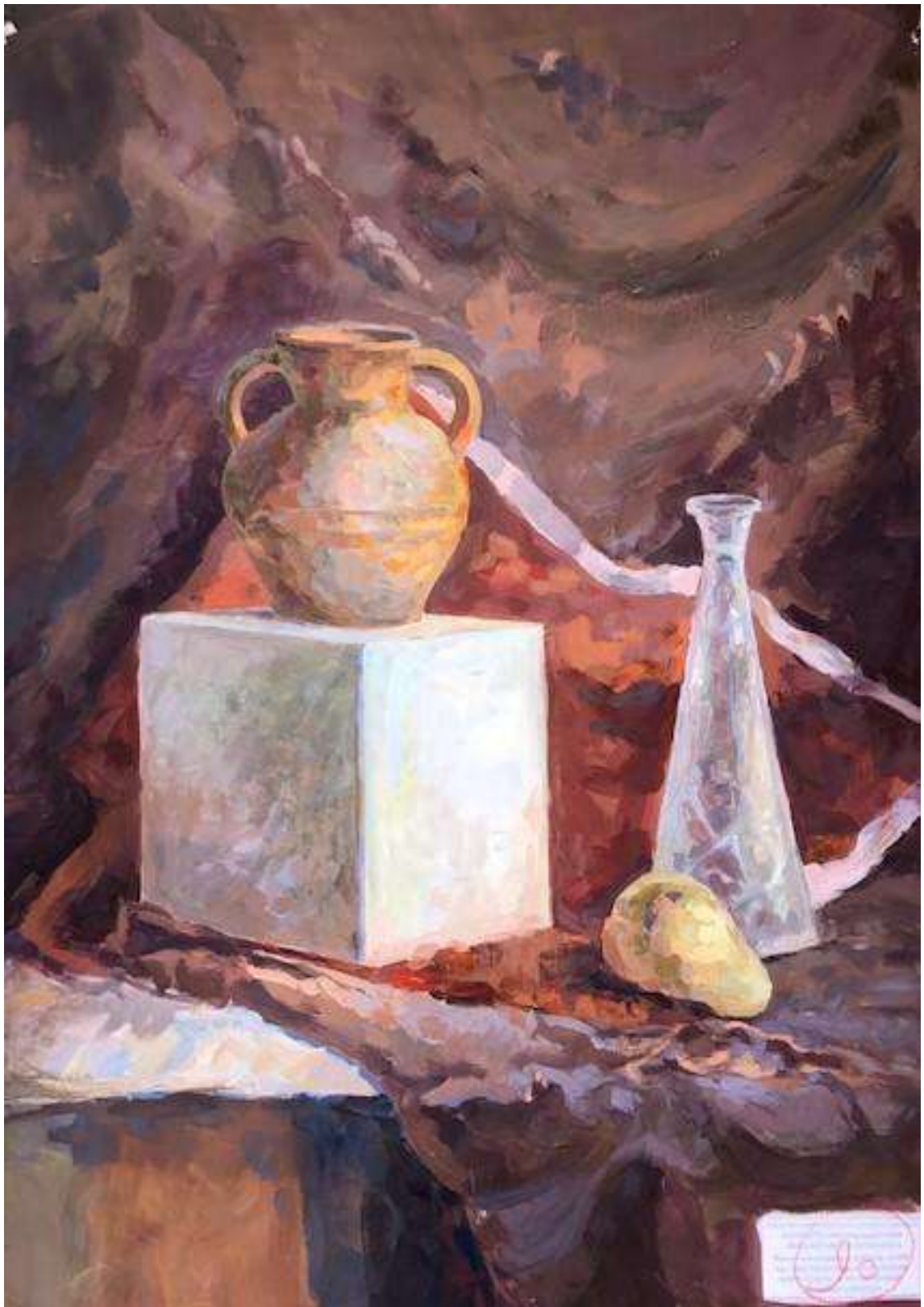
Семёнова Таисия 90 баллов