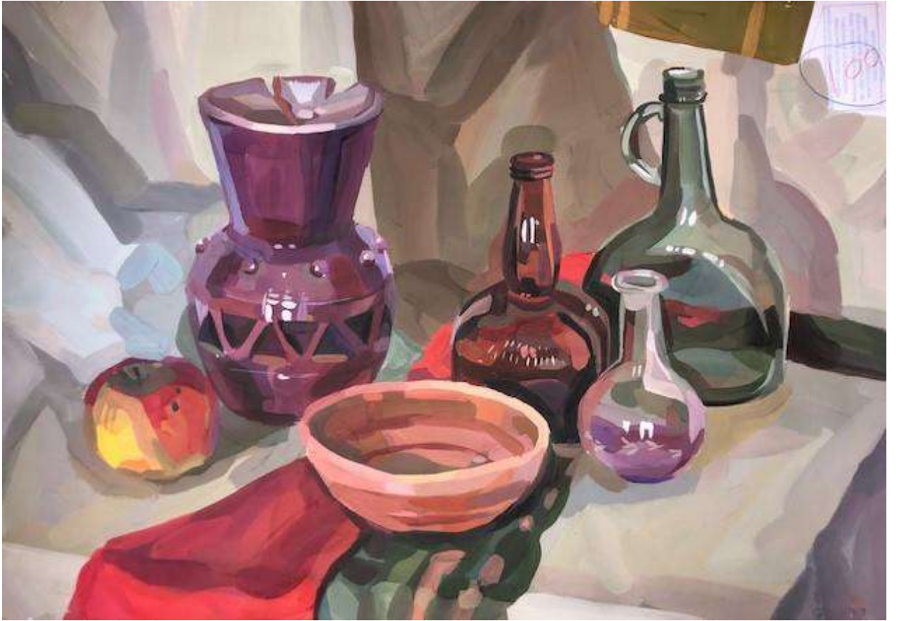
Черник Маргарита 100 баллов