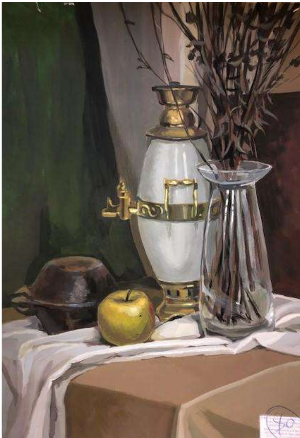
Возняк Дарья 80 баллов