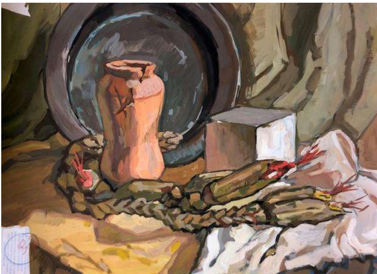
Чернякова Дарья 90 баллов