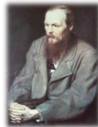
Федор Михайлович Достоевский