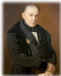
Василий Андреевич Жуковский

По 2 балла — за правильное указание, является ли данная личность современником Великого князя