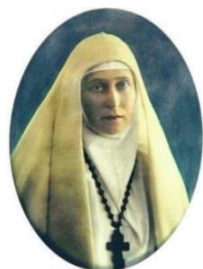
Святая преподобномученица Великая княгиня Елисавета Феодоровна