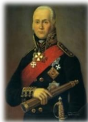
Святой праведный воин Федор Ушаков