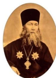
Архимандрит Антонин (Капустин)