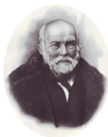
Николай Иванович Пирогов