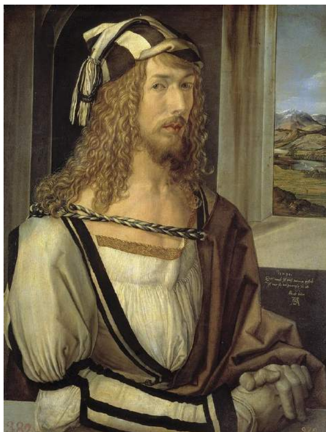
Альбрехт Дюрер. Автопортрет. 1498.