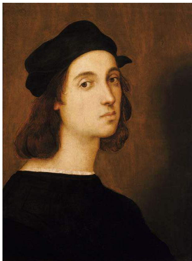
Рафаэль Санти. Автопортрет. 1506.

Перед вами две картины на схожий сюжет: автопортреты художников. Проанализируйте сходство и различия этих произведений. Порассуждайте о живописном языке эпохи Ренессанса.