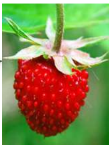
Е – Земляника