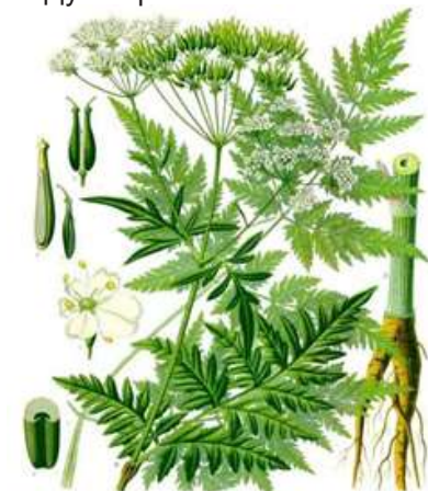
Д. Купырь лесной