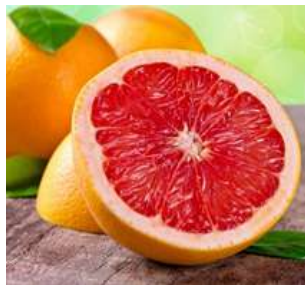
В – Грейпфрут