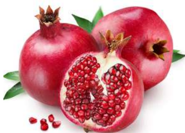
Д – Гранат