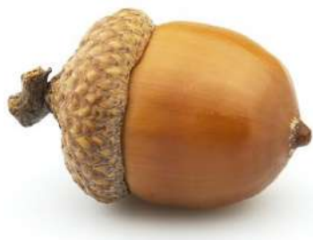
А – Жёлудь

Задача 1 (6 баллов). На рисунках изображены пять плодов, которые приспособлены для распространения животными (зоохория). Однако привлекательными для животных являются разные части плода. Укажите для каждого из плодов, какие его части являются съедобными для животных распространяющих данный плод.