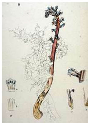
В. Заразиха бледноцветковая