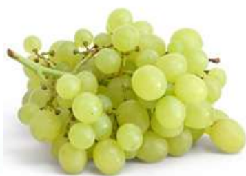
Б – Виноград