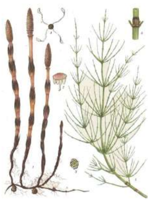
Б. Хвощ полевой