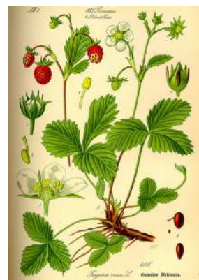
Г. Земляника лесная