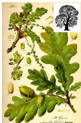
А. Дуб черешчатый

Задача 5 (5 баллов). На рисунках изображены пять различных представителей высших растений. Найдите «лишнее» растение в данном ряду. При этом укажите «лишнее» (отличающимся от прочих в ряду) растение отдельно по каждому из предложенных критериев.