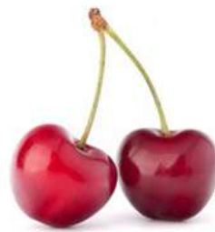
Г – Вишня