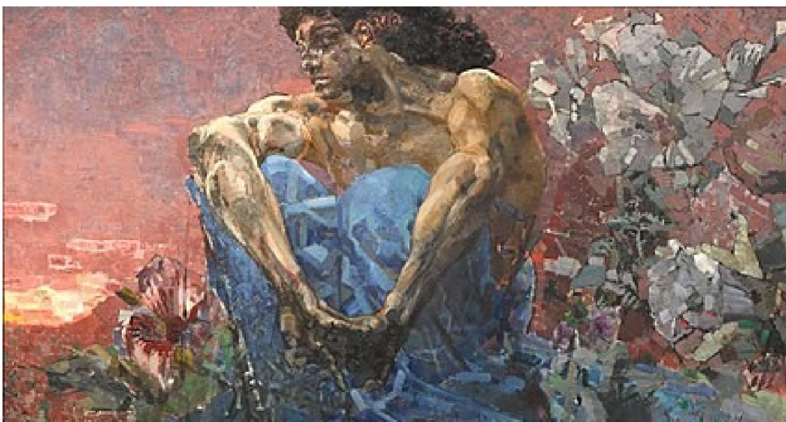
Михаил Врубель. Демон сидящий (1890). Холст, масло. 114 ×211 см. Государственная Третьяковская галерея. Москва. РФ.