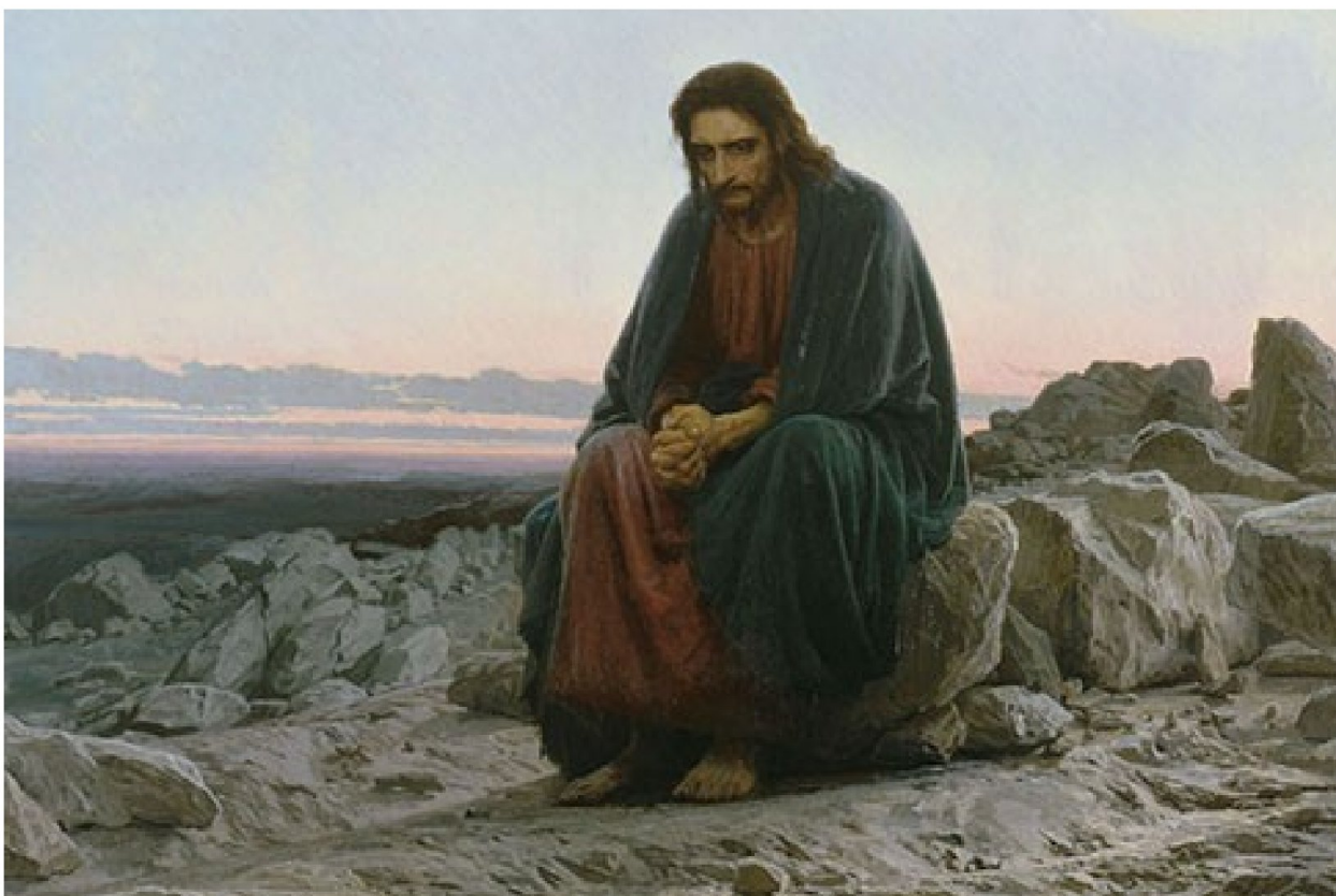
Николай Крамской. Христос в пустыне (1872). Холст, масло. 180×210 см. Государственная Третьяковская галерея. Москва. РФ.