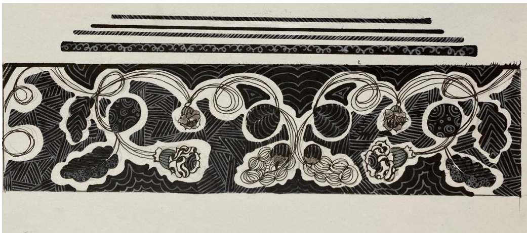
Пример работы по декоративной композиции на тему «Мой лес» с элементами лесной флоры