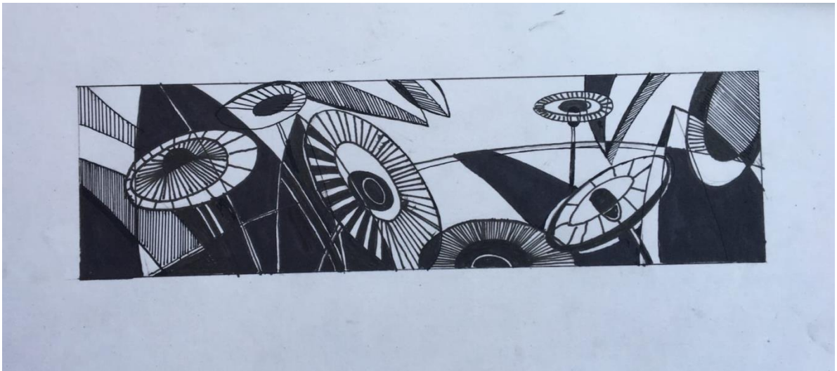
Пример работы по декоративной композиции на тему «Мой сад» с использованием плоскостного изображения геометрических фигур