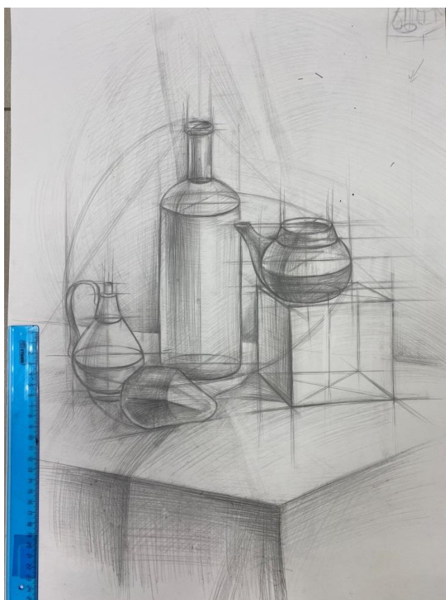
Примеры работ по техническому рисунку «Натюрморт»