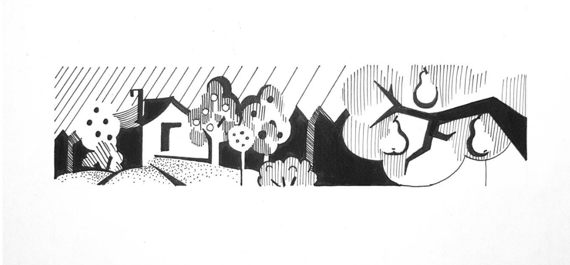
Пример работы по декоративной композиции на тему «Мой сад» с элементами ландшафтного дизайна

Техника выполнения в черно-белой графике (карандаш, тушь, перо, гелевая ручка). Задание выполняется на белой бумаге формата А-4.