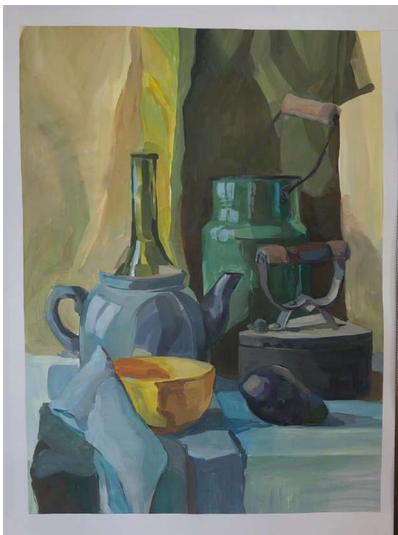
Пример работы по академическому живописи «Натюрморт»