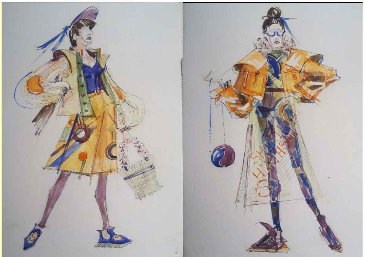
Пример работы по композиции «Эскиз костюма»