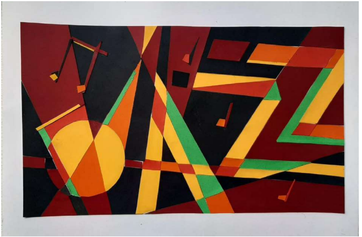
Пример работы по композиции «Цветная плоскостная»