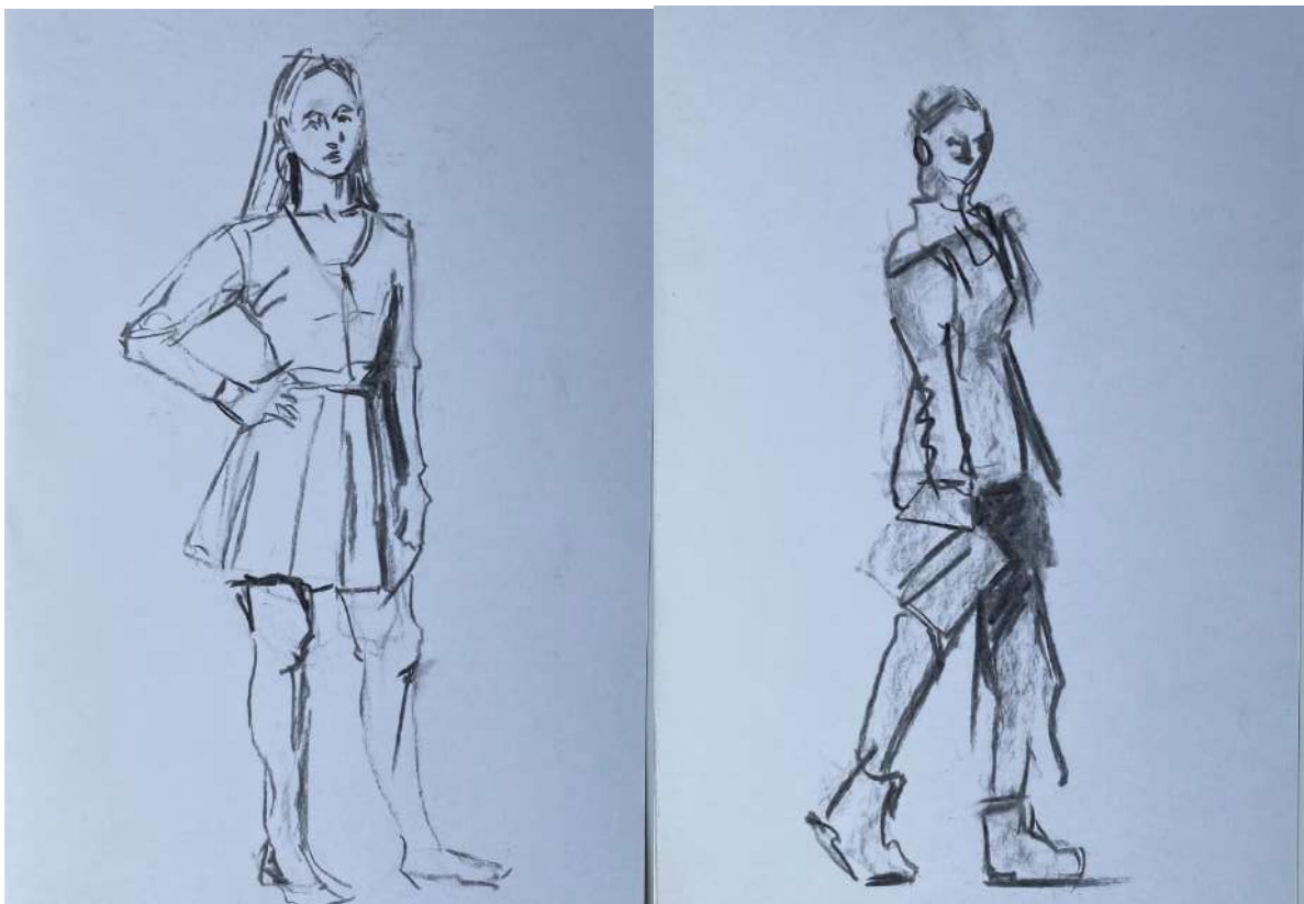
Пример работы по академическому рисунку «Рисунок фигуры человека»