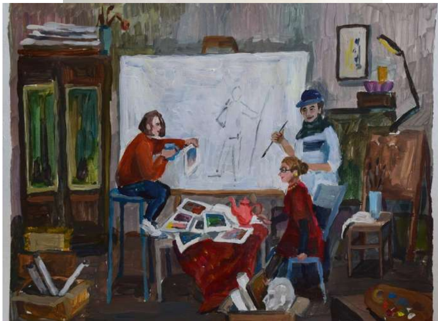
Пример работы по композиции «Станковая композиция»