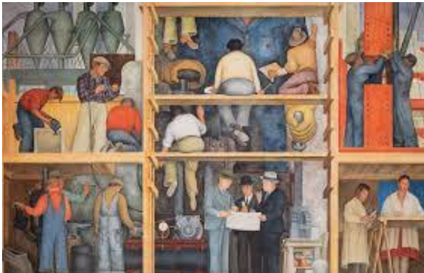
РИСУНОК 4.2 Темпы распространения новых технологий возрастают

Ниже приведены картинки и диаграммы из «Доклада о мировом развитии 2019: Изменение характера труда». Напишите эссе на тему «Как изменится труд человека в ближайшие десятилетия и что нужно сделать человеку, чтобы успешно конкурировать с искусственным интеллектом», опираясь на критерии оценивания, перечисленные ниже.