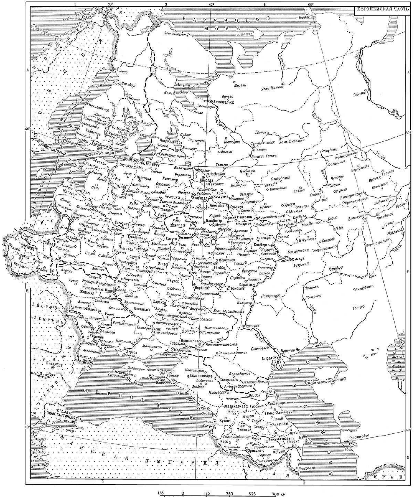
РОССИЙСКАЯ ИМПЕРИЯ, ПОЛИТИКО-АДМИНИСТРАТИВНАЯ КАРТА (на 1914 г.)

а) 1721 г., б) 1756 г., в) 1801 г., г) 1914 г. (свой ответ обведите кружком)