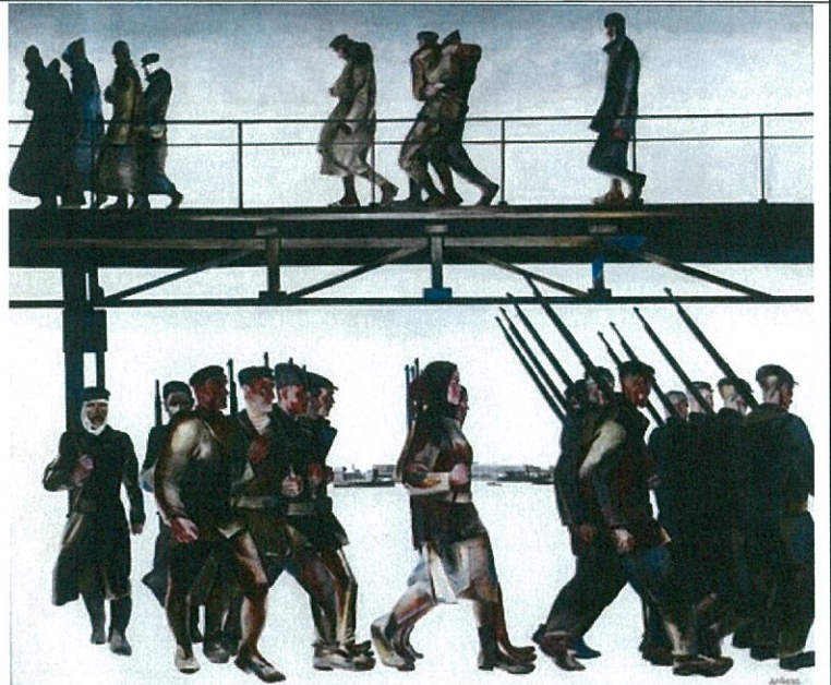
А.А. Дейнека. Оборона Петрограда. 1928 г.