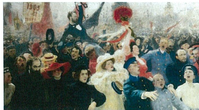
И. Е. Репин 17 октября 1905 года 1907, 1911