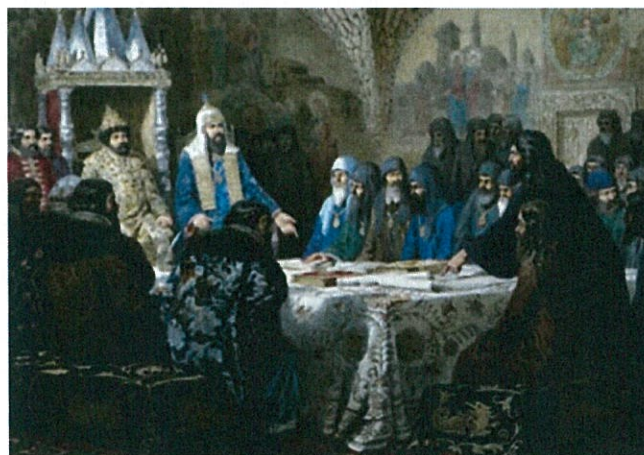
А. Д. Кившенко. Церковный Собор 1654 года. 1880.