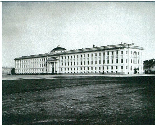
Здание Сената (Сенатский дворец). Фото 1884 г.