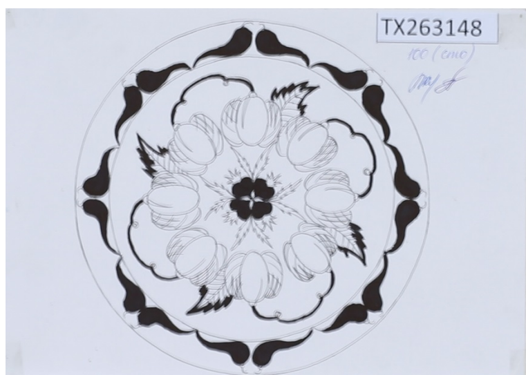
Пример работы по декоративной композиции с элементами овощей и грибов