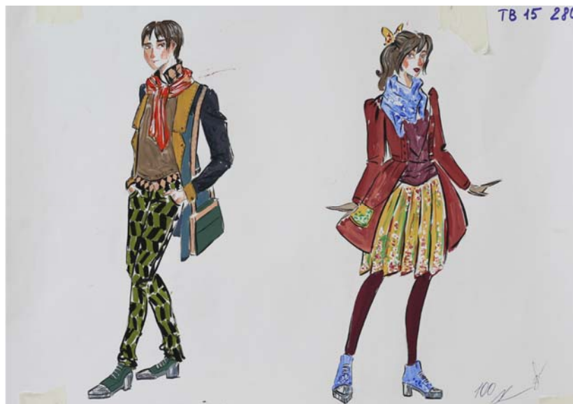
Пример работы по композиции «Эскиз костюма»