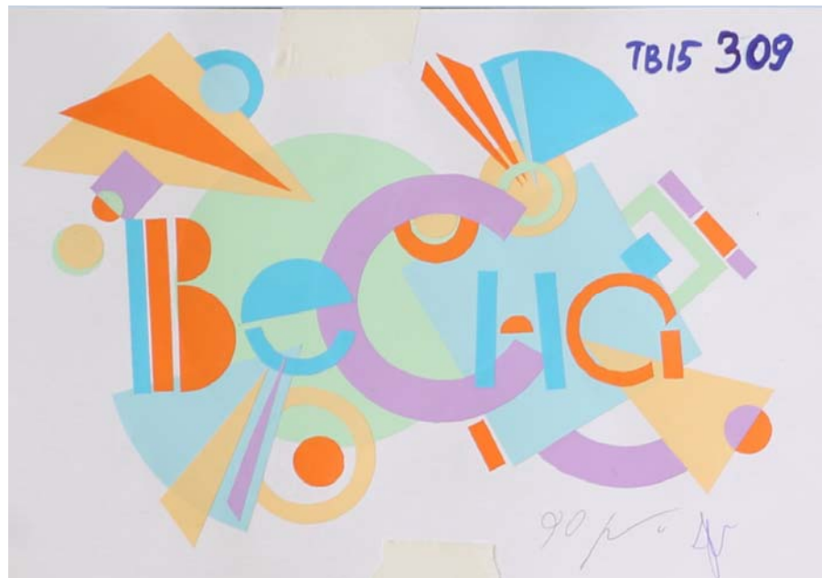
Пример работы по композиции «Плоскостная хроматическая композиция»