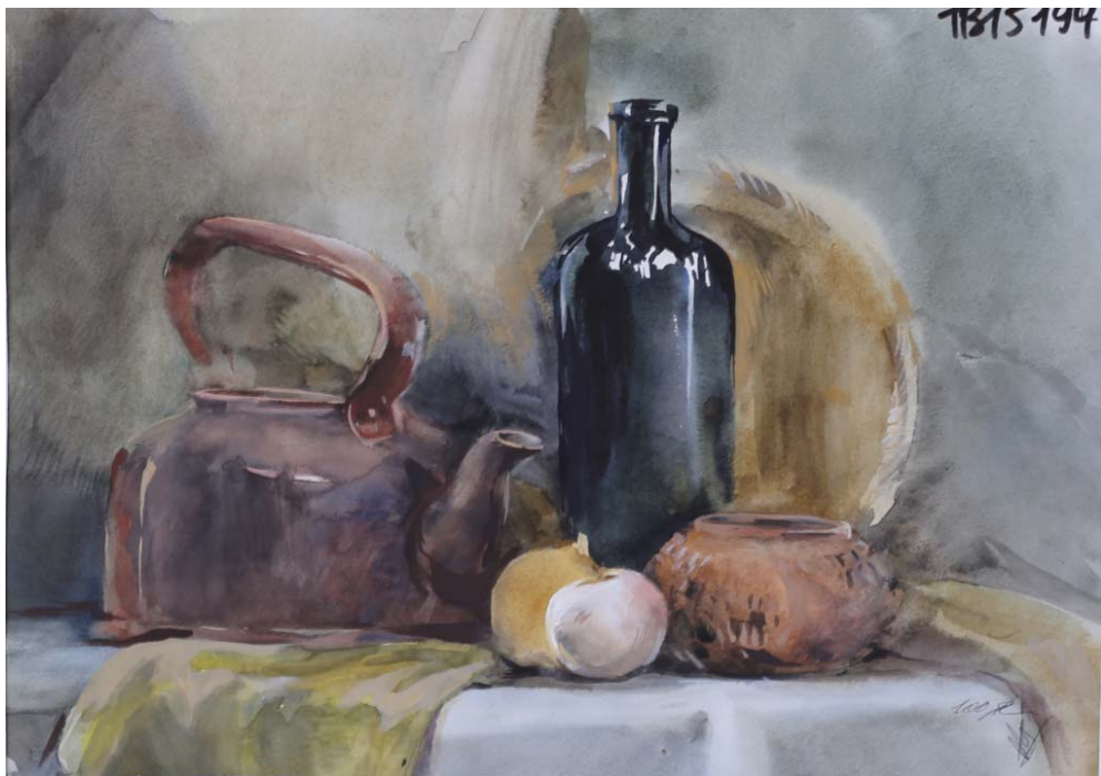
Пример работы по академическому живописи «Натюрморт»