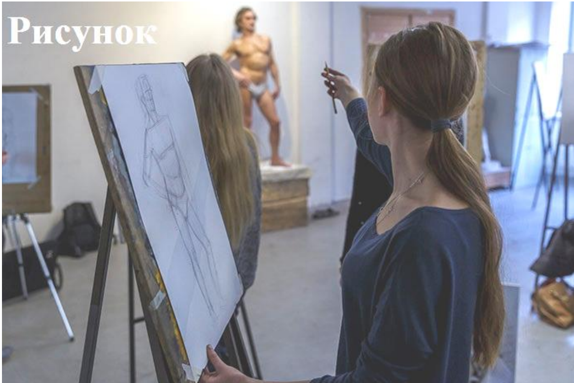
РИСУНОК. Олимпиада по рисунку состояла из двух заданий различной сложности. Так же как и в живописи, состязания по рисунку проходили в учебных аудиториях МГХПА, специально предназначенных для занятий академическим рисунком.

Задание 1: рисунок гипсового слепка итальянской головы с плечевым поясом или капитель, материал: карандаш, продолжительность 6 часов плюс 1 час на обед, 1 день. В каждой аудитории был размещен слепок головы и капитель, и участник олимпиады сам мог выбрать, что ему рисовать.