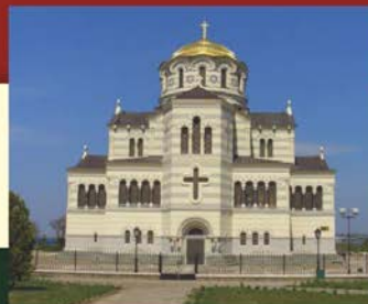
Князь-Владимирский собор был заложен в 1854 году

Слово «херсонес» переводят с греческого как «полуостров». Херсонес Таврический был основан древнегреческими колонистами более 2,5 тысяч лет назад в Крыму. Этот город, по преданию, посещал святой апостол Андрей, здесь принял мученическую кончину святой Климент Римский.