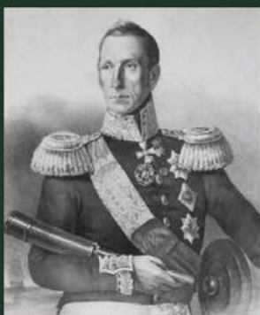
Вице-адмирал А.С. Грейг

Идея увековечить место крещения князя Владимира принадлежала главнокомандующему Черноморским флотом вице-адмиралу А.С. Грейгу. По его инициативе в 1827 году начались раскопки в Херсонесе