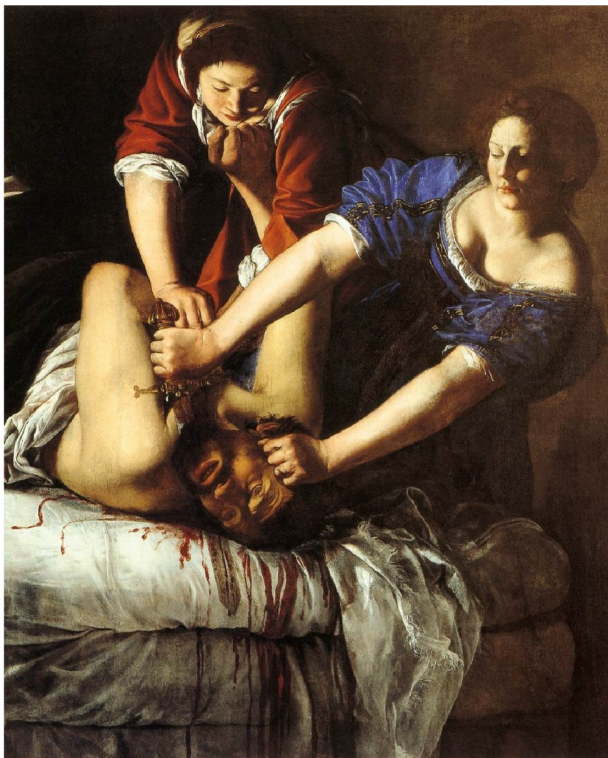
Артемизия Джентилески. Юдифь и Олоферн. 1611-1612.