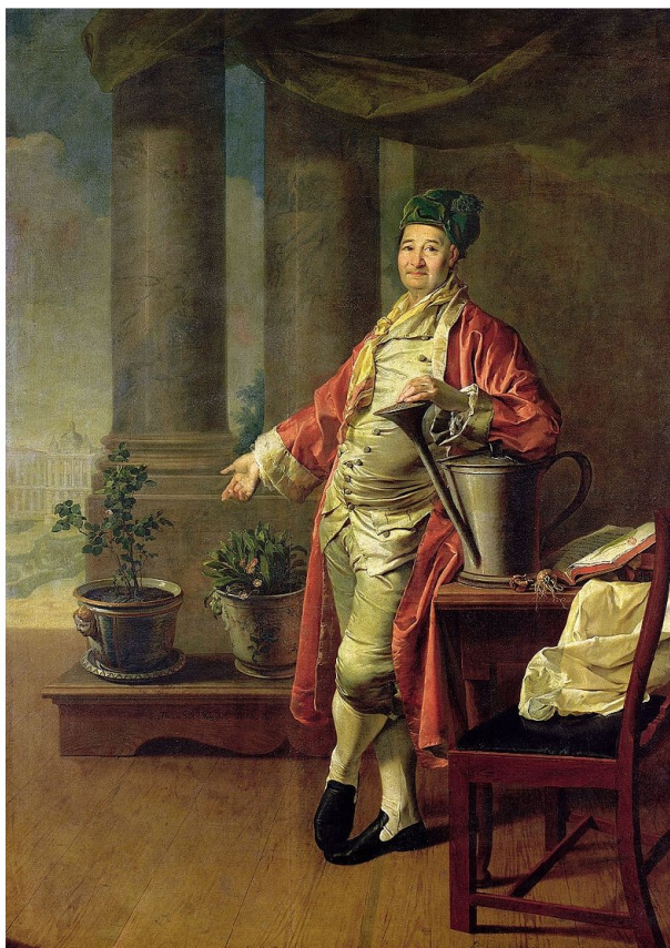
2.8. Укажите название и автора этой картины.