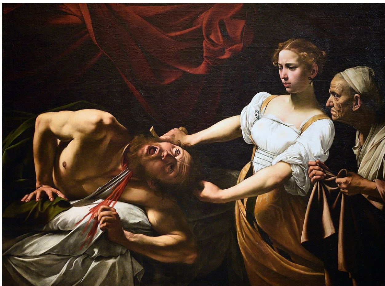
Микеланджело да Караваджо. Юдифь и Олоферн. 1599.

Перед вами две картины, раскрывающие сюжет о Юдифи и Олоферне. Проанализируйте сходство и различия этих произведений. Порассуждайте о стиле художников и особенностях эпохи Барокко.