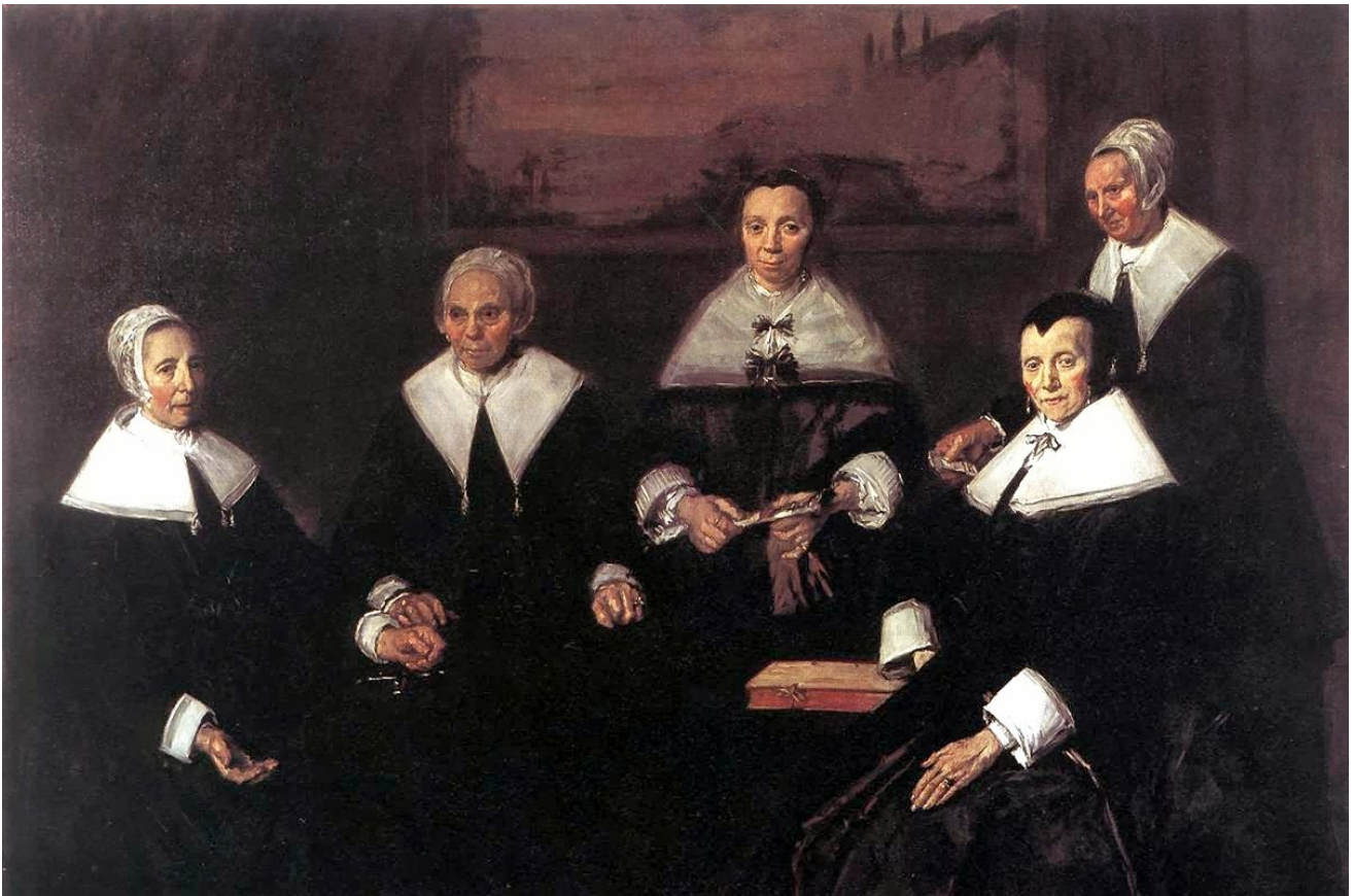
Франс Хальс. Регентши Приюта для престарелых в Гарлеме. 1664.