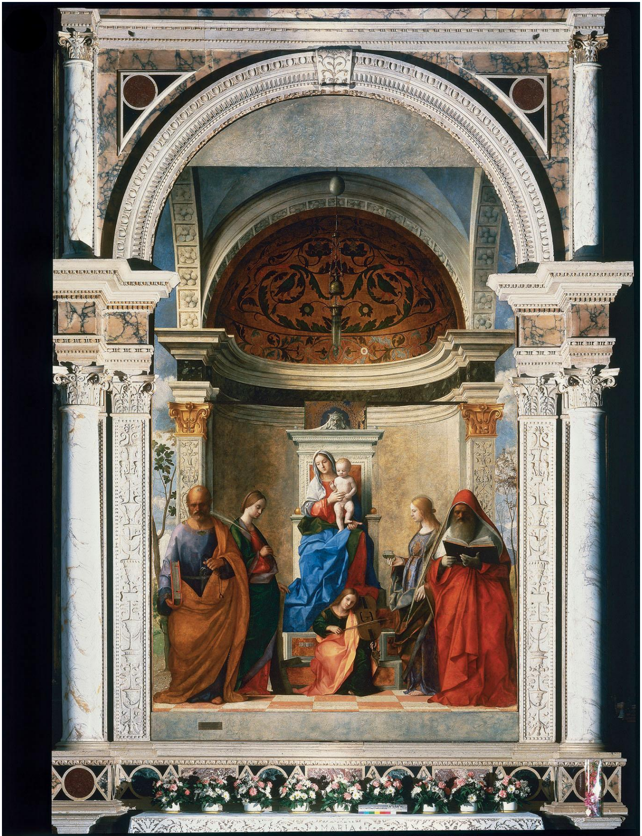
Джованни Беллини. Мадонна Сан-Дзаккария. 1505.