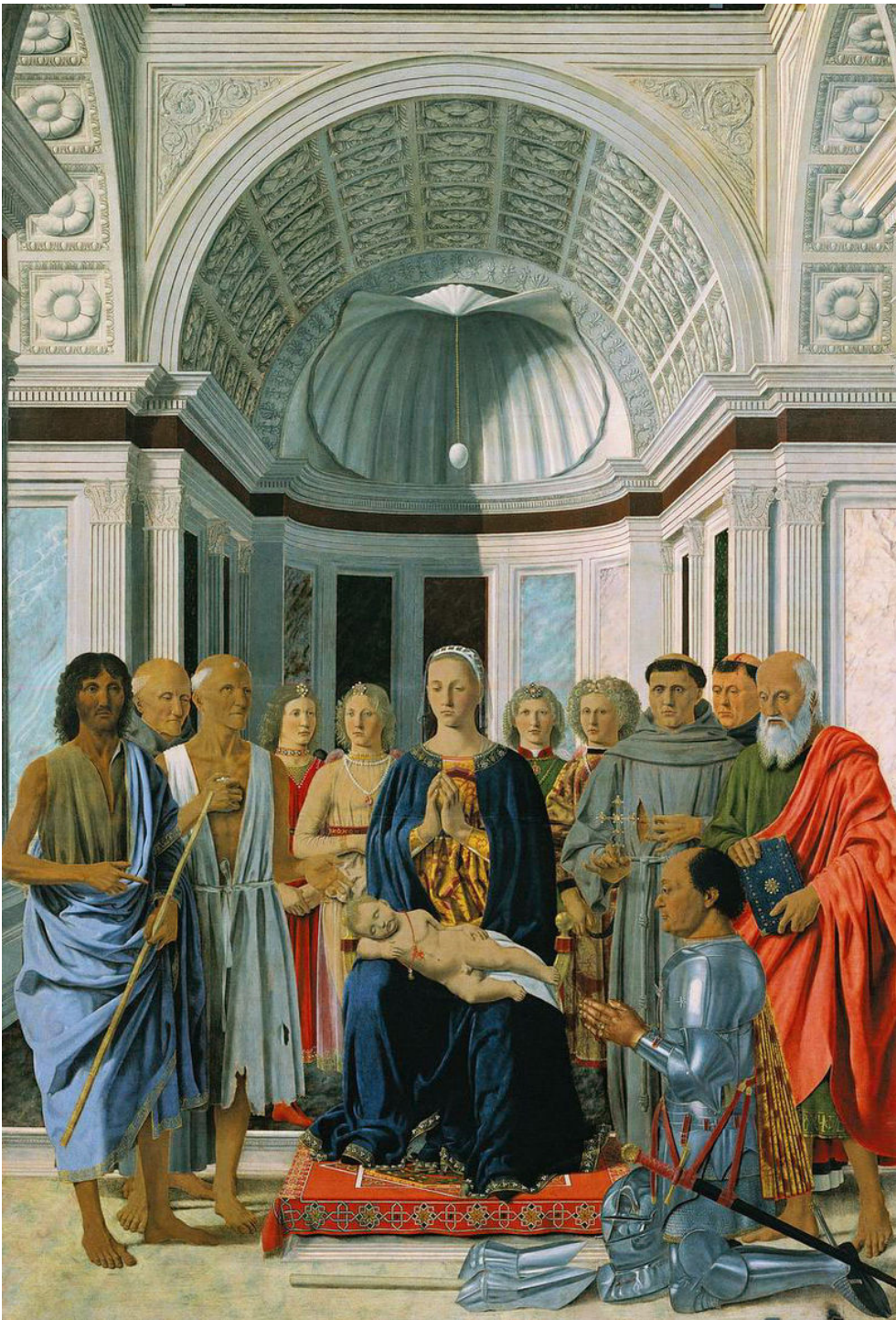
Пьеро делла Франческа. Алтарь Монтефельтро. 1472-1474.

С.1. Перед вами две картины на схожий сюжет: Мадонна с младенцем в окружении святых. Проанализируйте сходство и различия этих произведений. Порассуждайте о живописном языке эпохи Ренессанса.