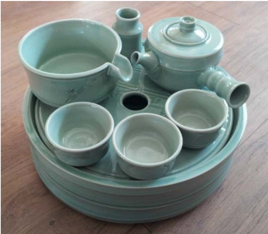
1) селадон; Селадон; селадоном; Селадоном -- ПРАВИЛЬНЫЙ

38. Какое название в буддизме закреплено за правителем, признаки появления которого в мире описывает цитата из сутры «Фо шо лунь ван ци бао цзин»: